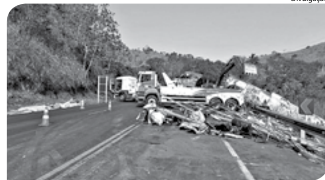
INTERDIÇÃO foi necessária para remover veículos