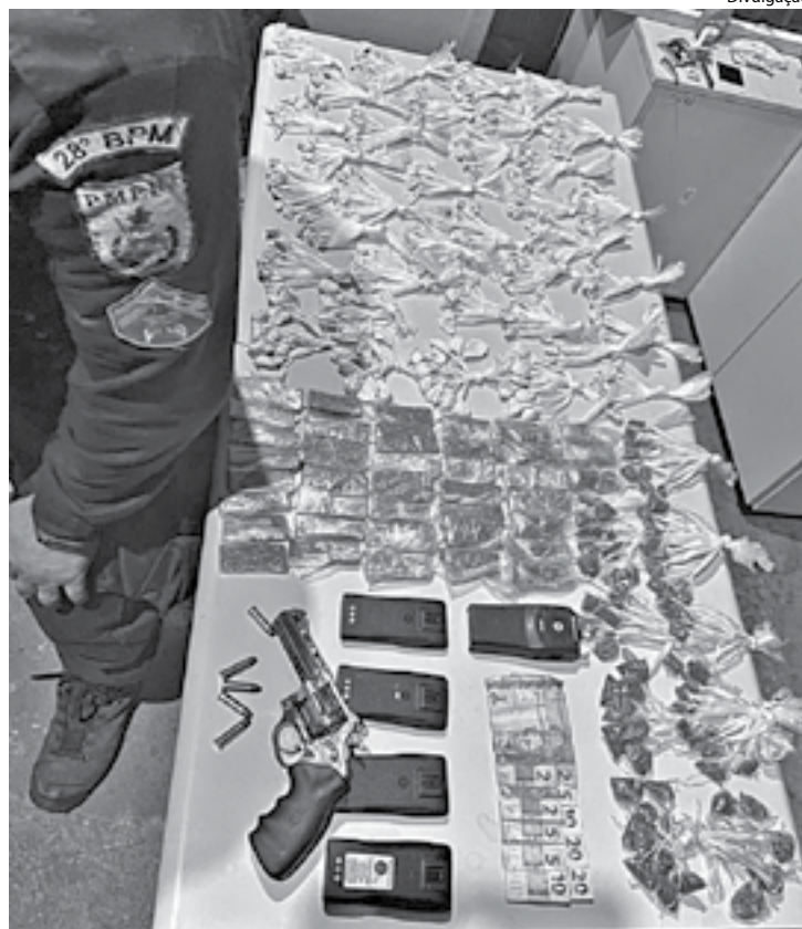
FLAGRANTE aconteceu após denúncia de tráfico, em Volta Redonda

Os dois foram encaminhados para a delegacia para as medidas necessárias.